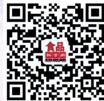
食品科学微信服务号