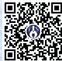
食品科学微信视频号