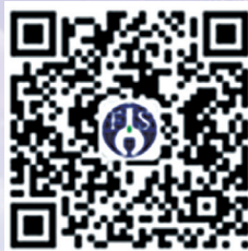
食品科学微信订阅号